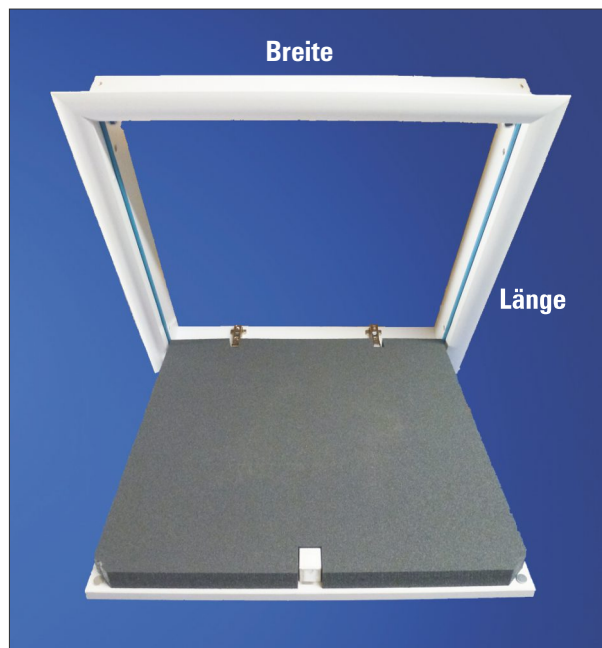
Abbildung: Deckentüre mit WärmeSchutz 3D.

inkl. Anschluss-System für dichte Ausführung der Einbaufuge